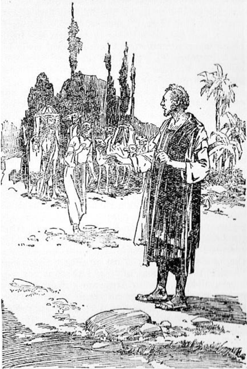
Образ одруження Христа та нареченої